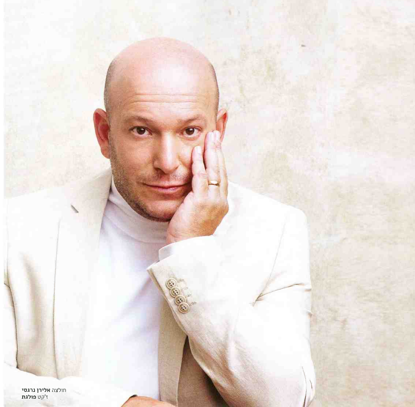
חולצה אלירן נרגסי ד'קט פולגת

מבין שעובר עליו המון, אבל מעט מאוד מזה יוצא החוצה. הדבר הקשה הוא להבין שהילד שלך, מגיל צעיר, רוצה לשמור אזורים שיהיו נסתרים ממך. אבל זה מה ששחרר אותי." אבל מילא לא לדעת מה הילדים שלך עושים. "אני חושב שהדבר שמחריד אותי יותר מכל, הוא אי ההבנה שלי את עצמי, אי ההבנה שלנו את עצמנו, אי היכולת לשלוט בעצמנו", הוא אומר. "ובאמת בכל הספרים שלי יש רגע של התפרצות שאי אפשר להסביר אותו באמת". הבעיה היא שקוראים רוצים להבין הכל. הם מצפים שבז'אנר הבלשי יהיה פתרון לכל פשע. הם עלולים לצאת לא מסופקים, כאילו שמדובר בסקס בלי אורגזמה.