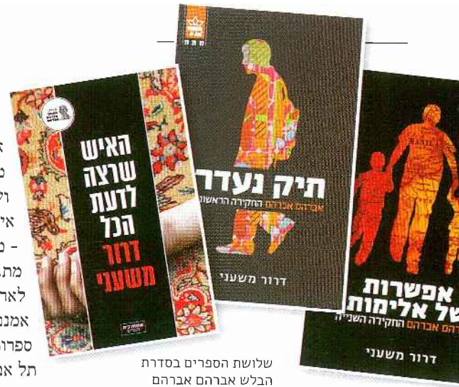
שלושת הספרים בסדרת הבלש אברהם אברהם

תפקיד של שוטה הכפר, אבל הוא לא גיבור. הסיבה שאין פה ספרי בלשים בהחלט קשורה גם לעובדה שהמשטרה, מבין כל ארגוני הביטחון, היא הארגון הכי מזולזל, וזה קשור לעבודה שזה היה, ועדיין, ארגון מזרחי ביחס לשאר הארגונים. זה לא המוסד עם ההילה שלו, זה לא חיל האוויר." אבל גם הגיבור שלך, איך נגיד בעדינות, הוא לא סקסי; בחלק מהמקרים הוא אפילו לא פותר את כל העלילה לגמרי.