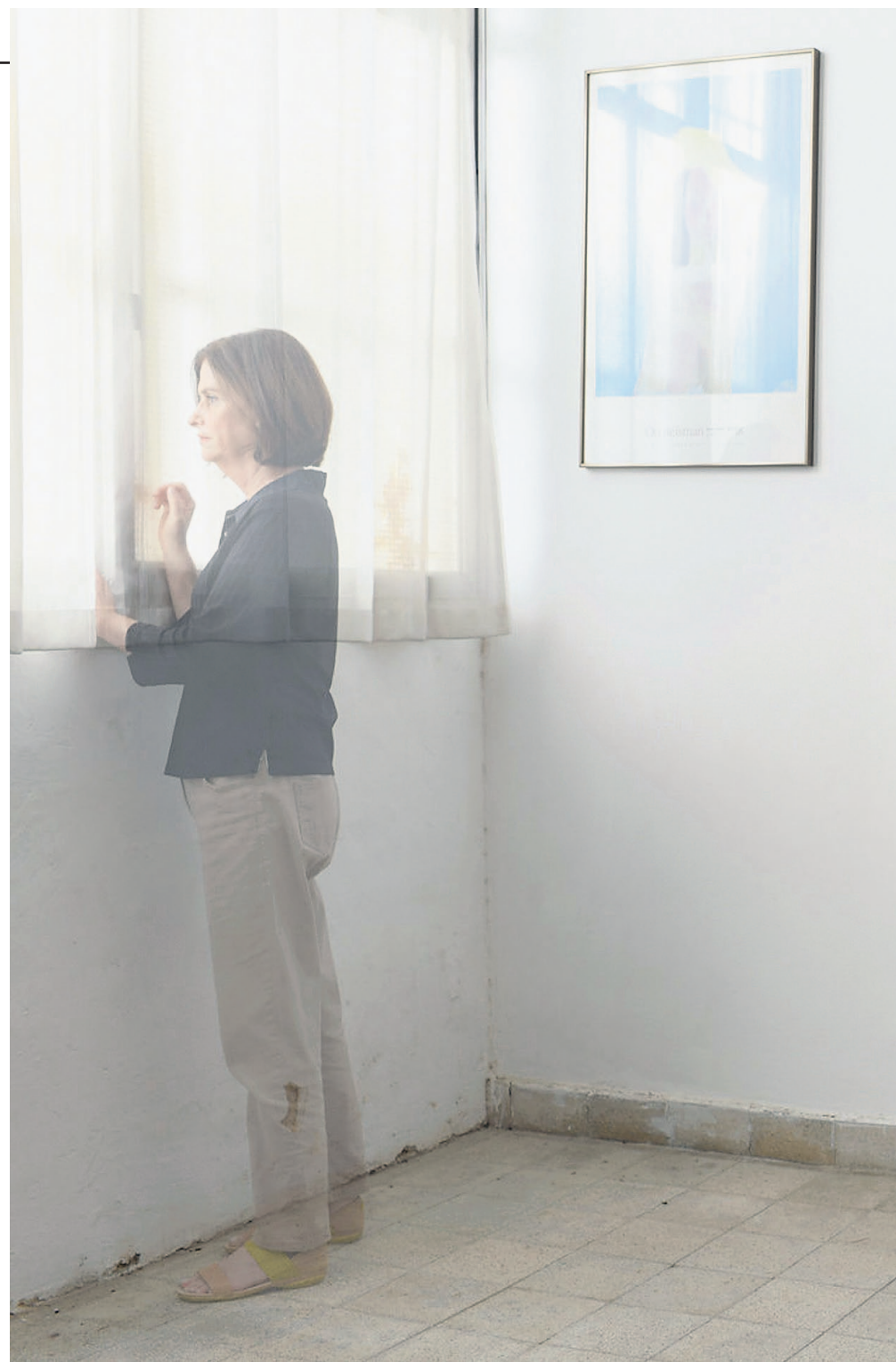
איפור: נעמי דלאל

"לא שאני רוצה להשוות בין נסיבות החיים שלנו, אבל אם יש נקודת השקה חזקה, היא קשורה לאמהות של שתינו", אומרת נאמן, שתיארה בסיפור בשם 'האופציה' איך אמה העבירה את שנות המלחמה האחרונות בהונגריה, כחולת שחפת בבית מרפא תחת הכיבוש הנאצי (הסיפור נפתח באזכור ניסיון ההתאבדות של האם אחרי שה-